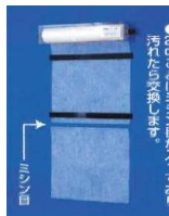
K-tool 制御盤フィルター