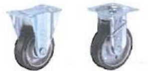
ハンマーキャスター 特殊ゴム車輪付きキャスター