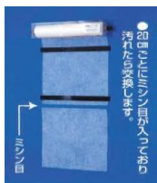
K-tool 制御盤フィルター