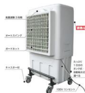
鎌倉製作所 アクアクール

また、コンプレッサを使用しないため騒音が小さく排熱も発生しません。節電と作業環境をアクアクールで改善可能です。一度、ご検討をお願いします。